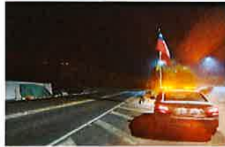
PATRULLAJE PREVENTIVO POR LAS DIFERENTES LOCALIDADES DE LA COMUNA.