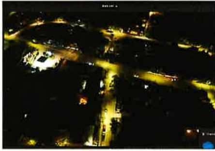
PATRULLAJE PREVENTIVO CON DRON EN EL SECTOR RESIDENCIAL Y COMERCIAL DE ZAPALLAR