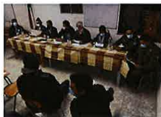
REUNION DE SEGURIDAD A CARGO DEL ALCALDE DE LA COMUNA, EN LA LOCALIDAD DE LA LAGUNA